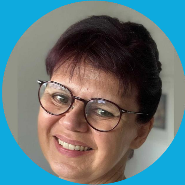
Dagmar Köhler Berufsbildende Schulen Burgdorf / Hannover

„ Eine große Bühne für großartige Ideen!