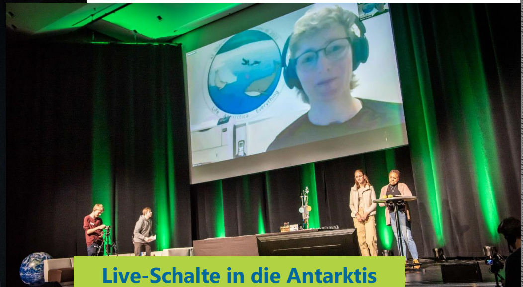
Live-Schalte in die Antarktis