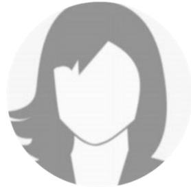
Vorname Name Personalverantwortliche/r klimaschützendes Unternehmen Stadt