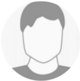
Vorname Name Stadt