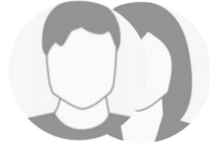
Vorname Namen Schüler-ReporterInnen Schule Stadt