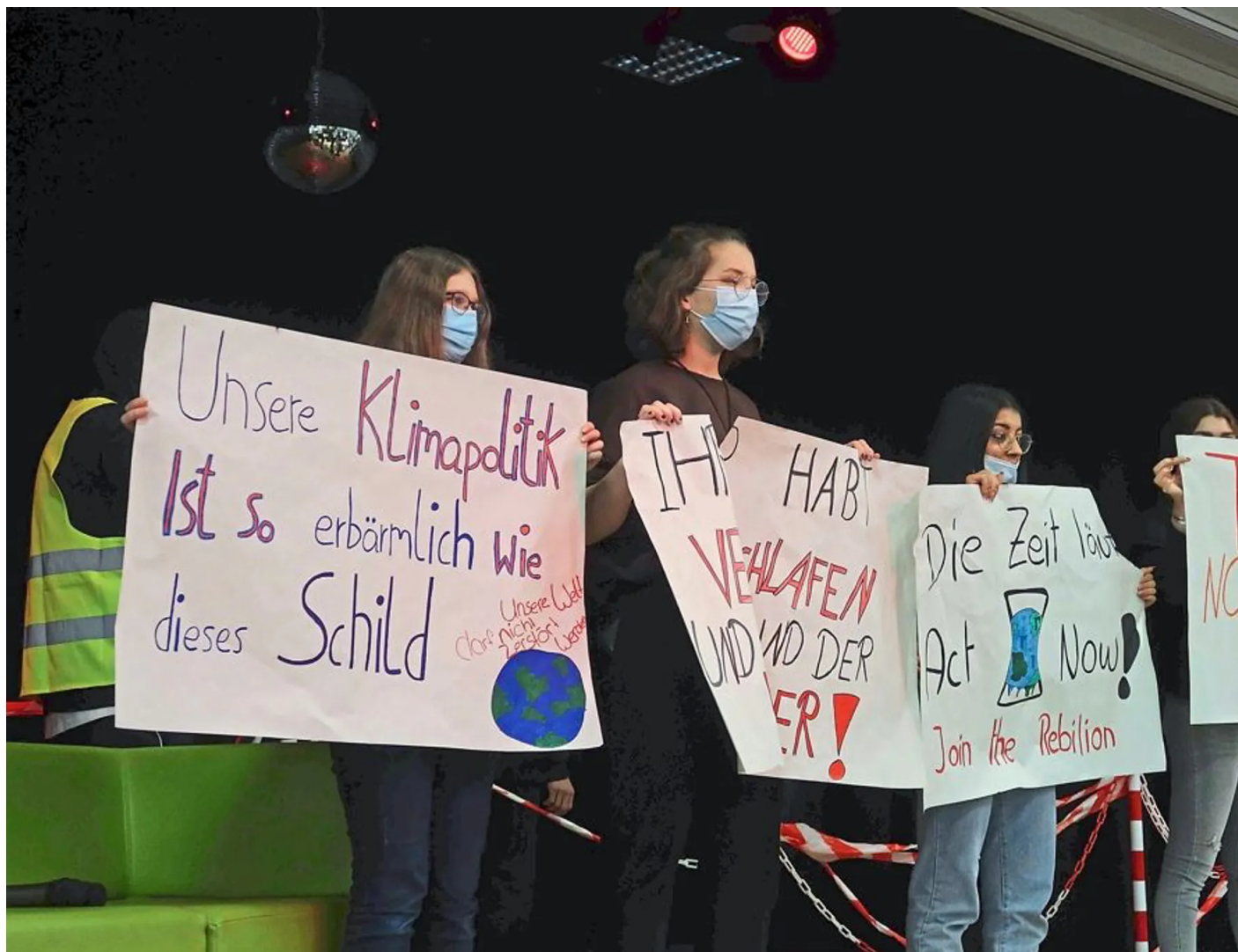
Schüler-Klimagipfel Lübbecke, Stadtschule, Climate Dance red light_0622