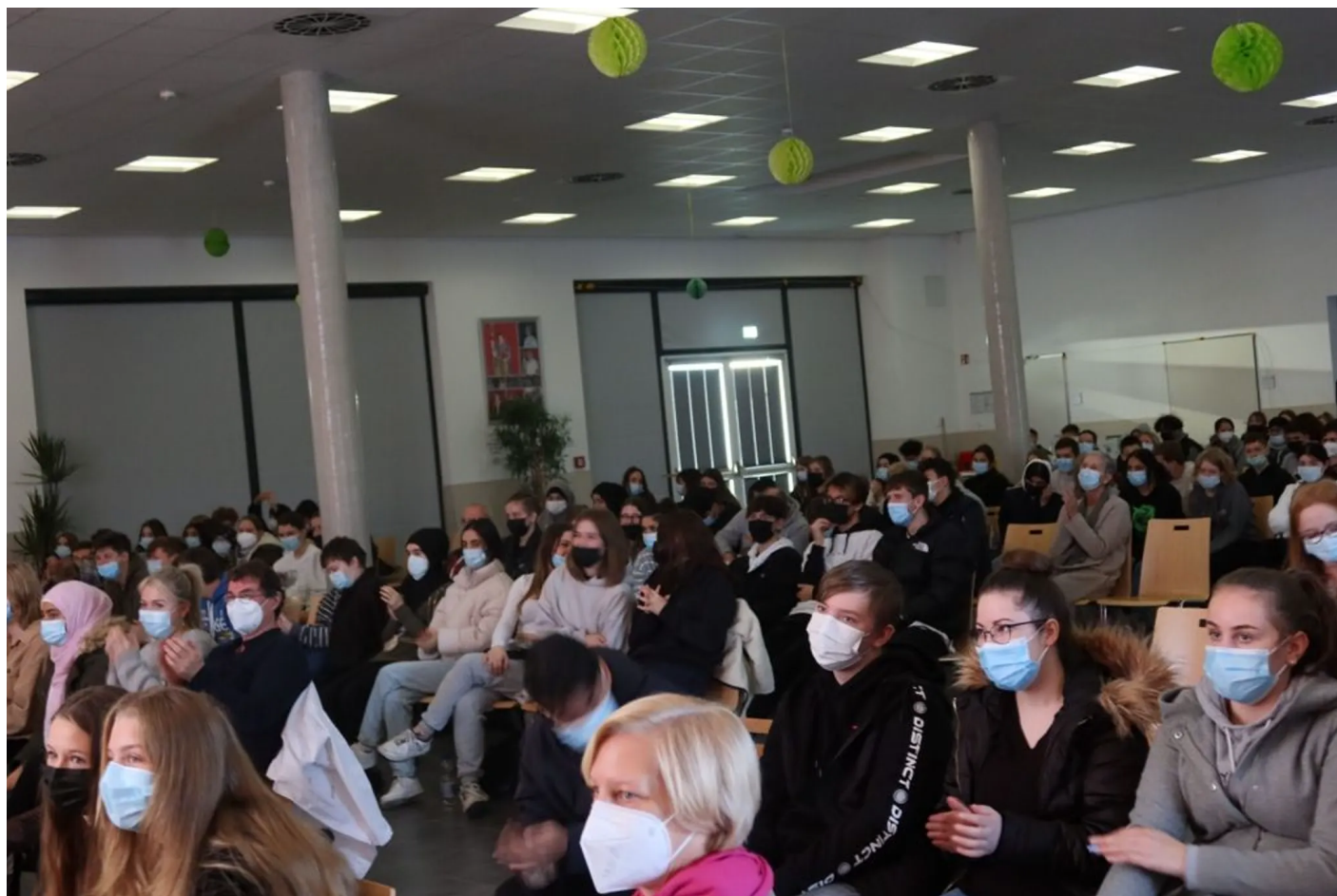
Das Publikum verfolgte aufmerksam die Beiträge beim Schüler-Klimagipfel in der Stadtschule.